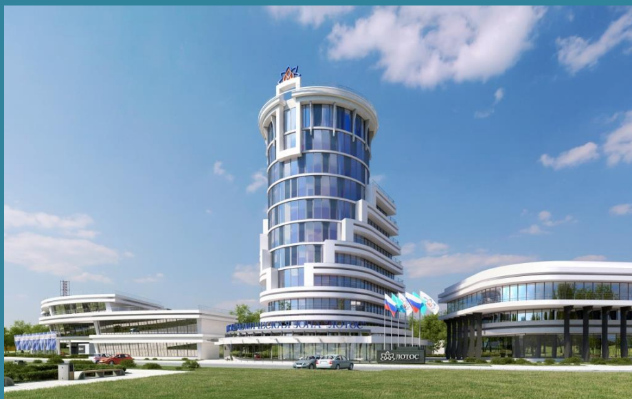
ساختمان مرکزی منطقه ویژه اقتصادی لوتوس

زمین منطقه ویژه اقتصادی لوتوس می‌تواند برای اهدافی از جمله صنعت، حمل و نقل، انرژی، ارتباطات، بخش و تلویزیون (رسانه)، انفورماتیک مورد استفاده قرار گیرد. برای ساکنان منطقه ویژه اقتصادی لوتوس نیز، یک قطعه زمین در منطقه لازم با ویژگی‌هایی از جمله خطوط آب و برق، جاده‌ها و تأسیسات فراهم می‌شود.